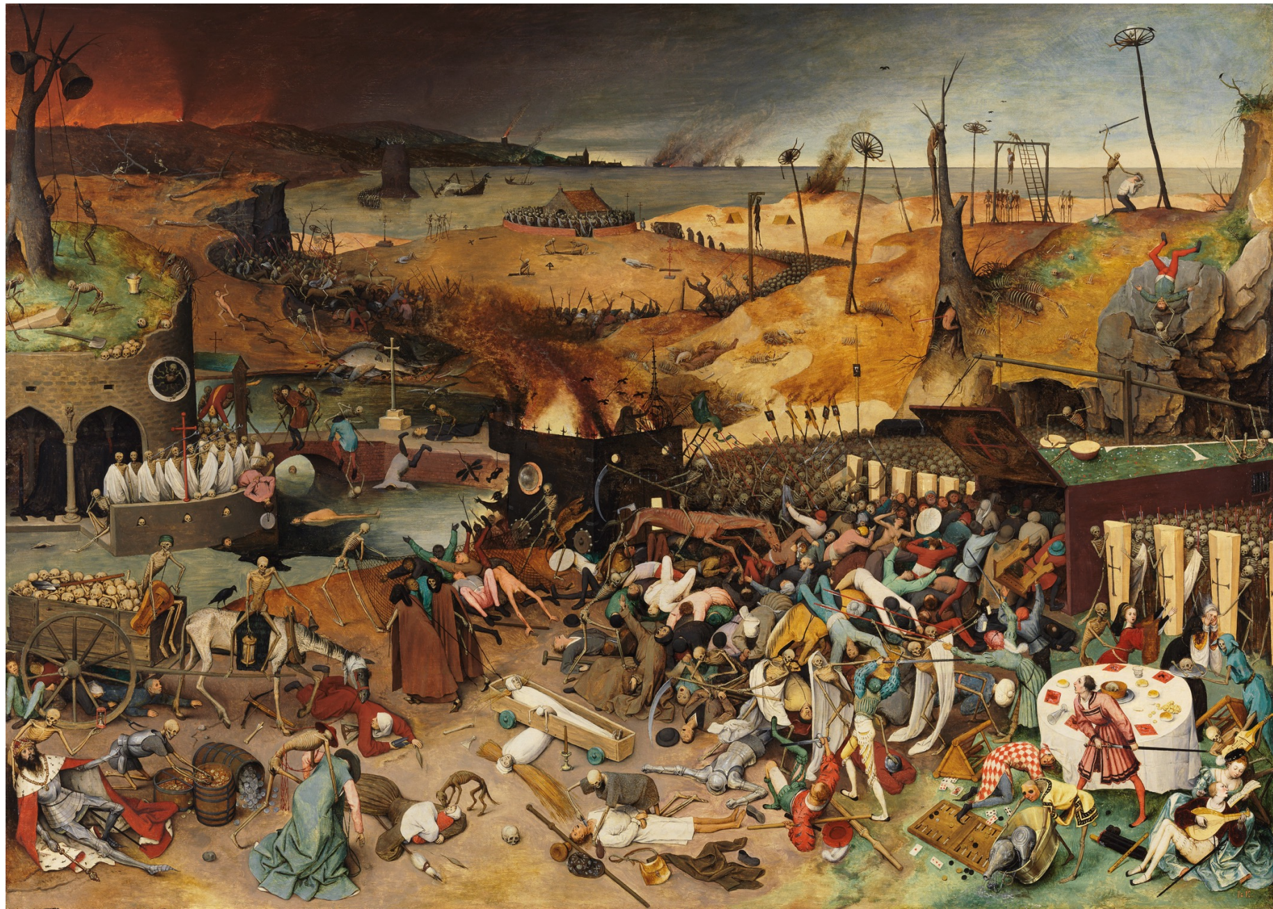
Pieter Bruegel il Vecchio, Trionfo della morte , 1562 circa, Madrid, Prado