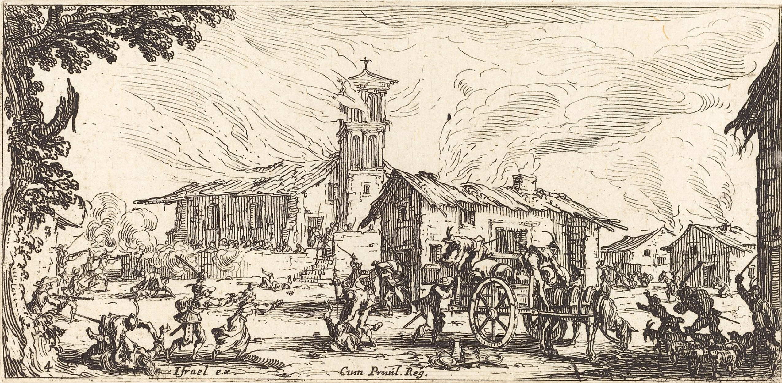
Jacques Callot, Les Petites Misères de la guerre , 1636, Il saccheggio di un villaggio , tavola 3