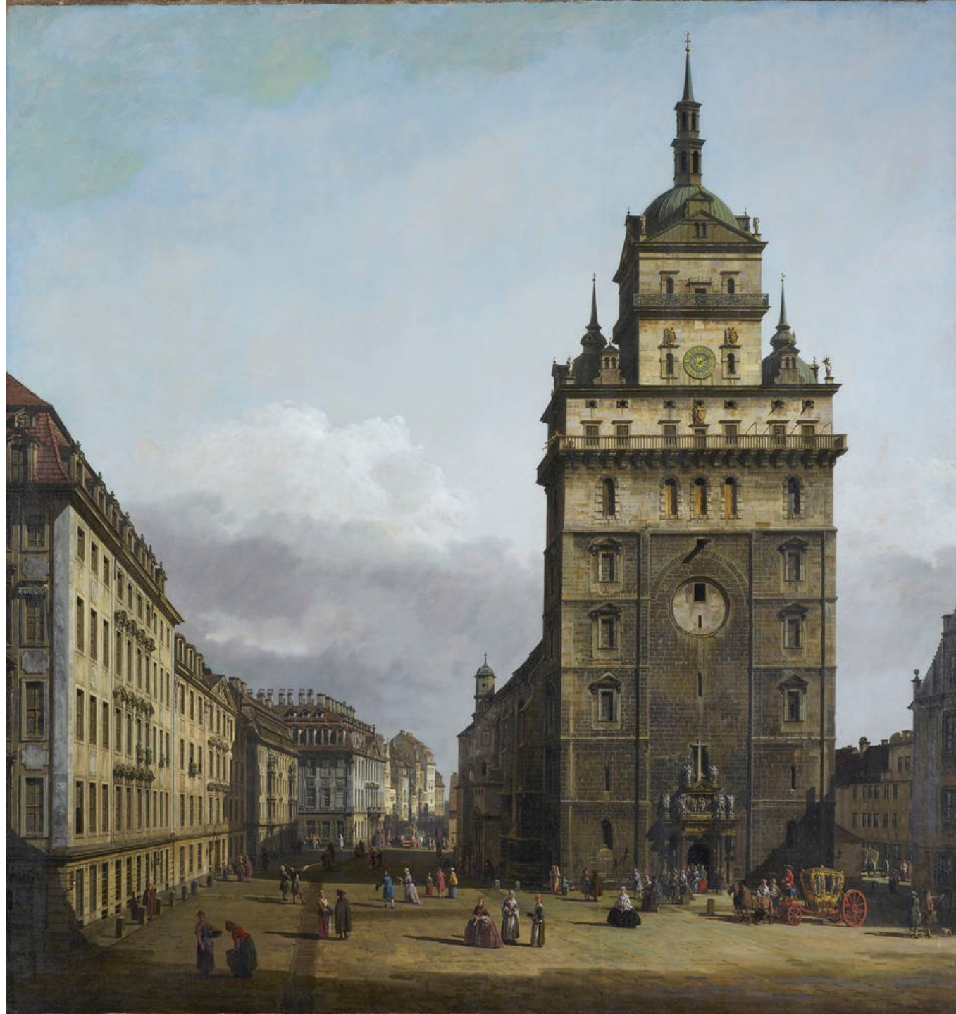
Bernardo Bellotto La Kreuzkirche a Dresda 1747-56 Dresda, Gemäldegalerie