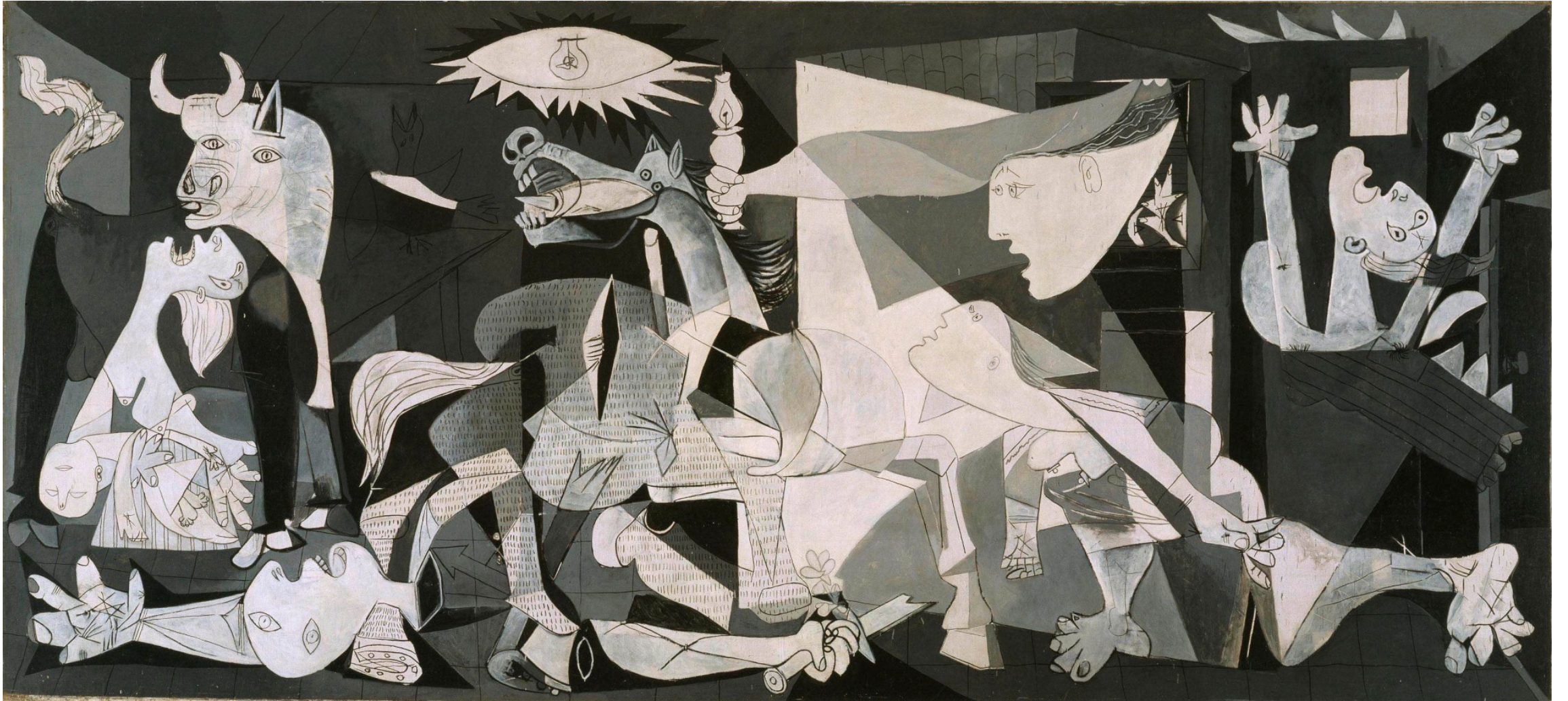
Guernica- P. Picasso, 1937, Museo del Prado