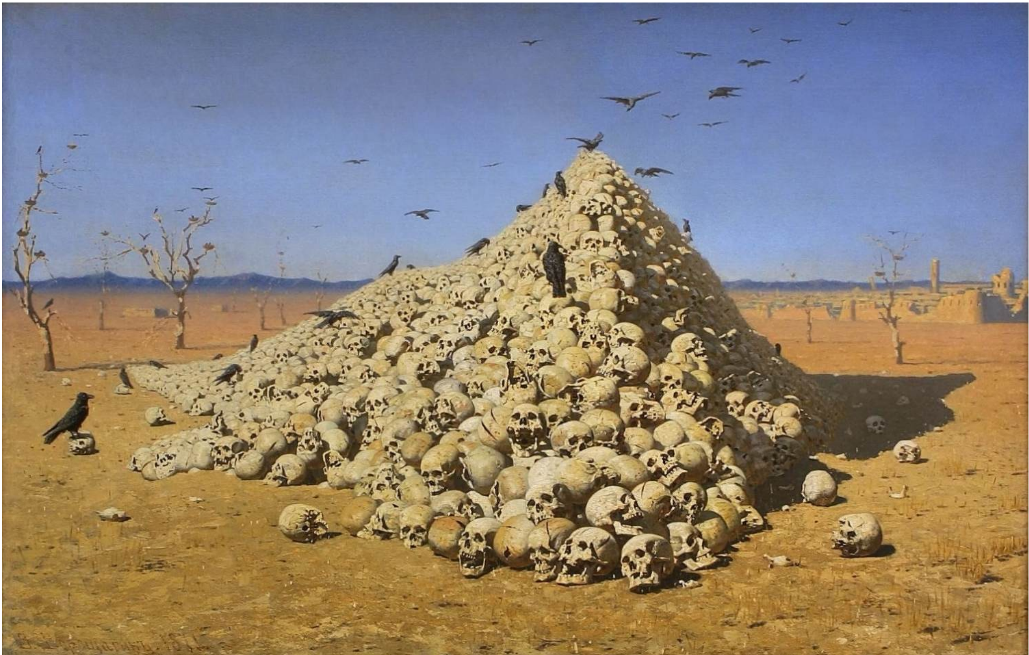
Vasilij Vereshchagin, Apoteosi della guerra , 1871, Mosca, Galleria Tret'jakov