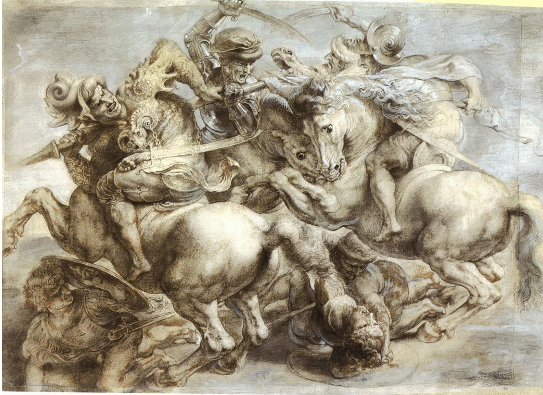
Peter Paul Rubens, Battaglia di Anghiari (copia del cartone perduto di Leonardo), 1603 circa Parigi, Louvre, Département des Arts Graphiques