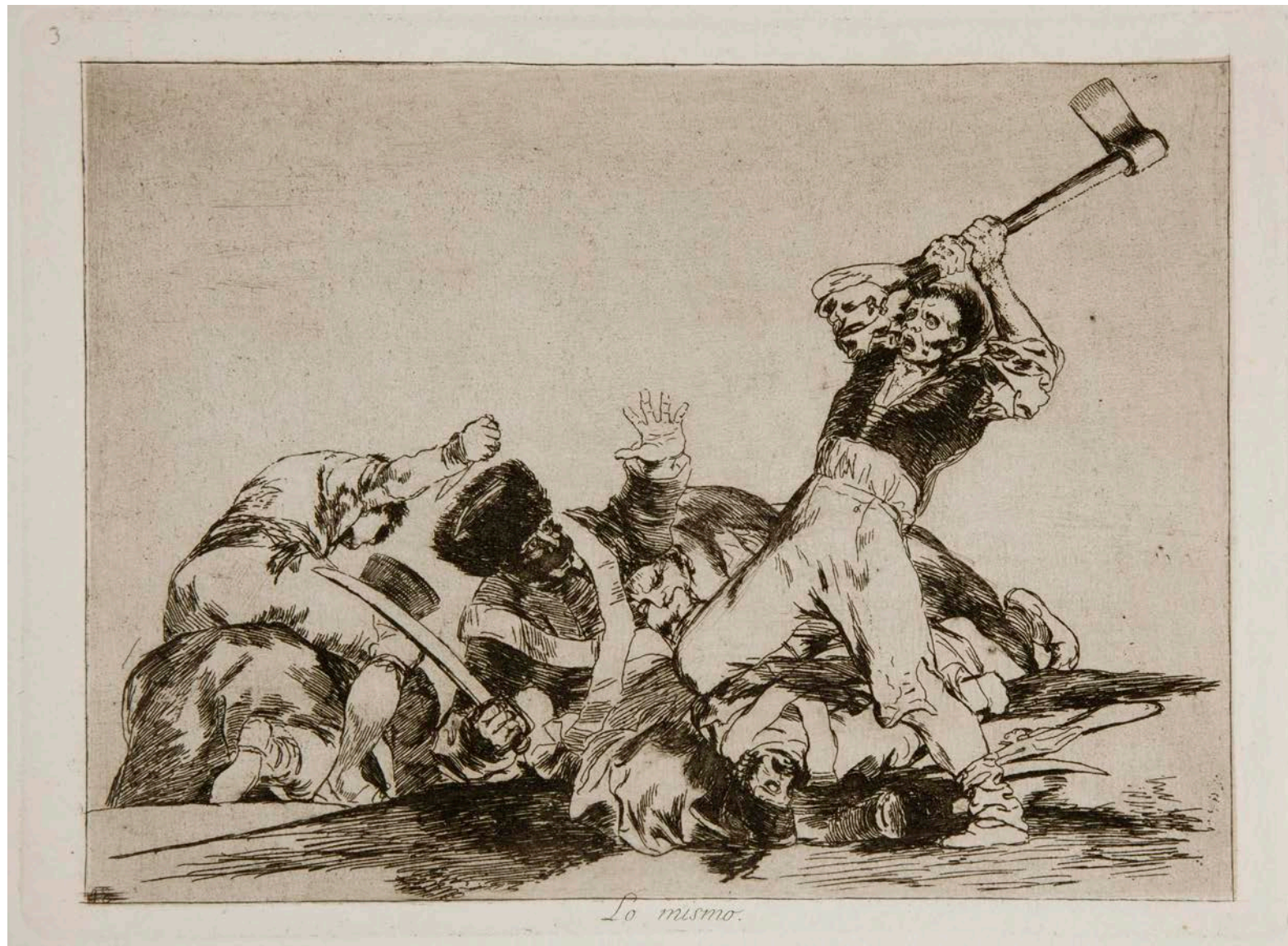
I Disastri della Guerra – F. Goya, 1863