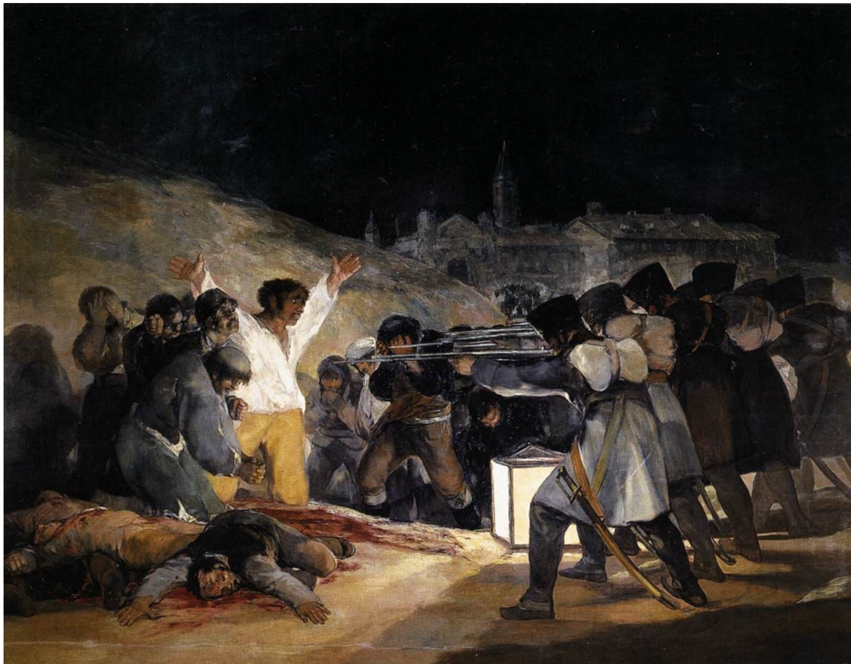
Francisco de Goya y Lucientes, Tre maggio 1808: esecuzione dei difensori di Madrid , 1814, Madrid, Prado