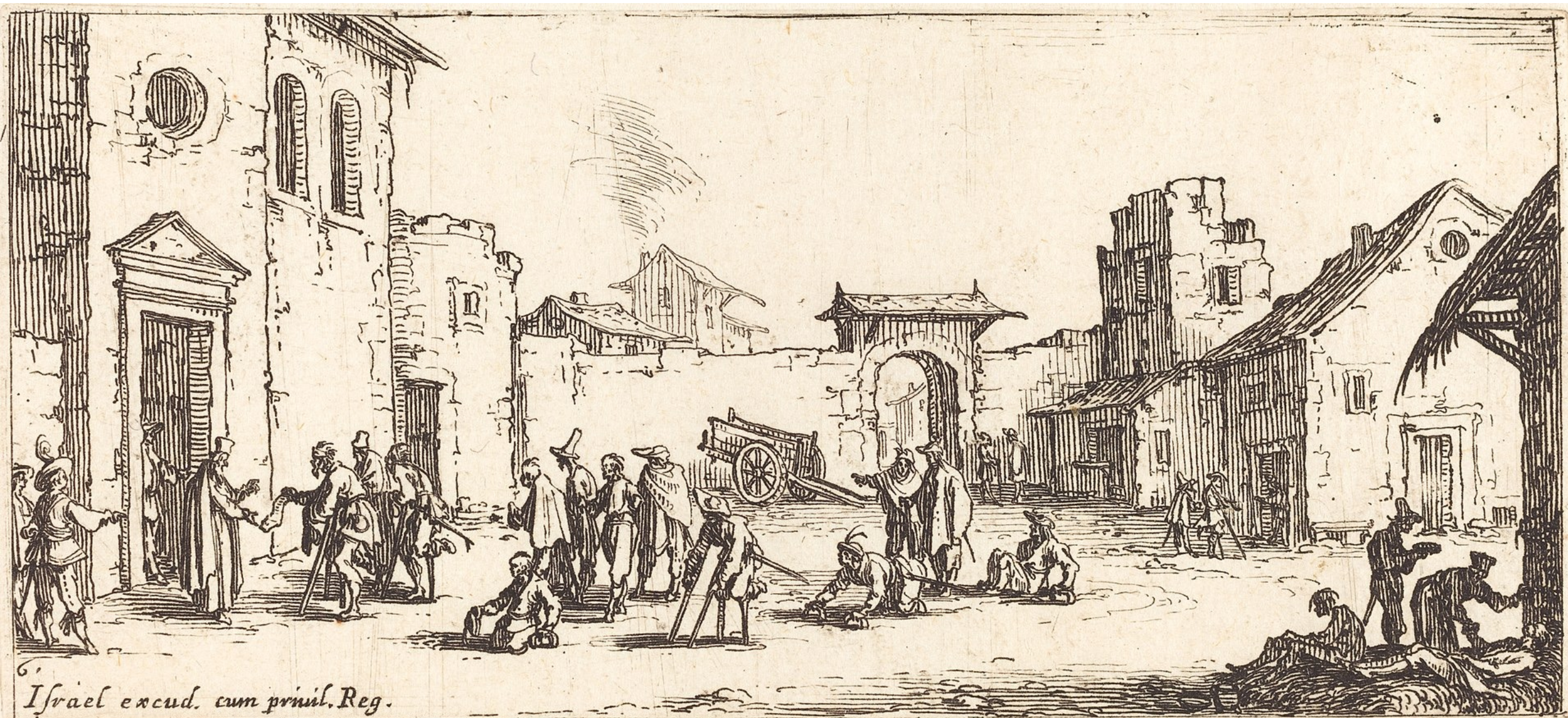
6. Israël excud. cum priviil. Reg.