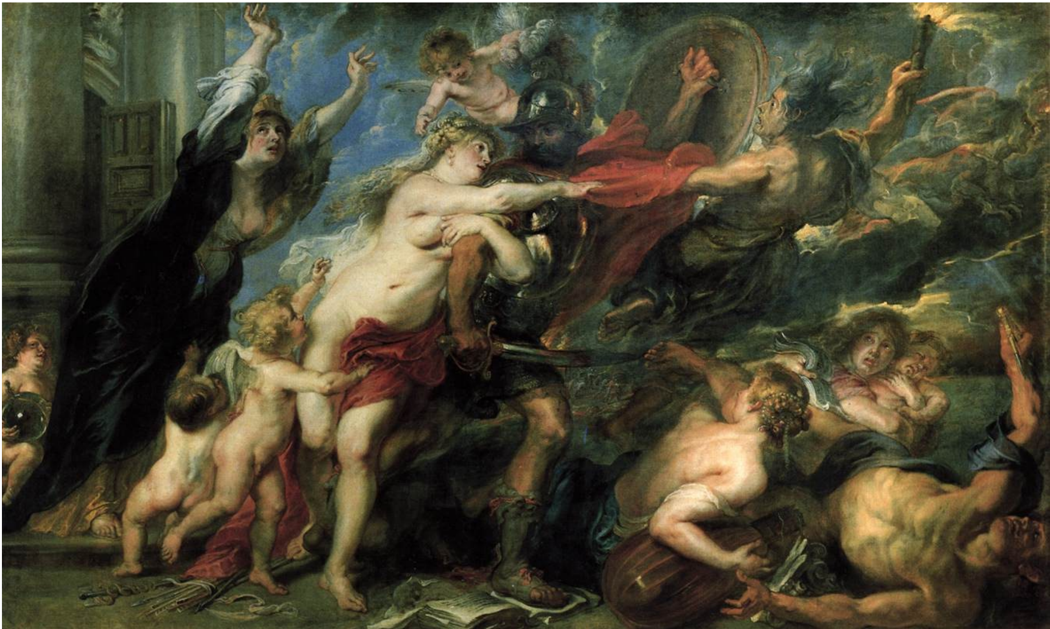
Peter Paul Rubens, Le conseguenze della guerra , 1637-1638, Firenze, Galleria Palatina di Palazzo Pitti