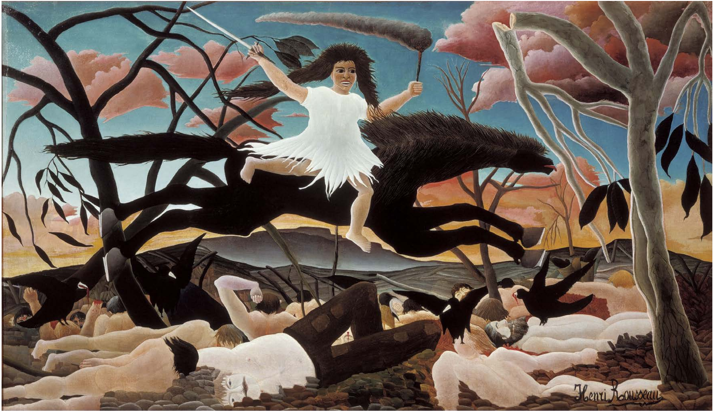
Henri Rousseau, La guerra , 1894, Parigi, Musée d'Orsay