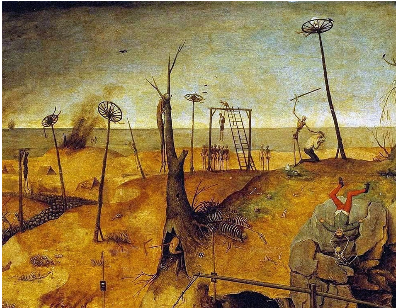
Pieter Bruegel il Vecchio, Trionfo della morte , particolare 1562 circa, Madrid, Prado