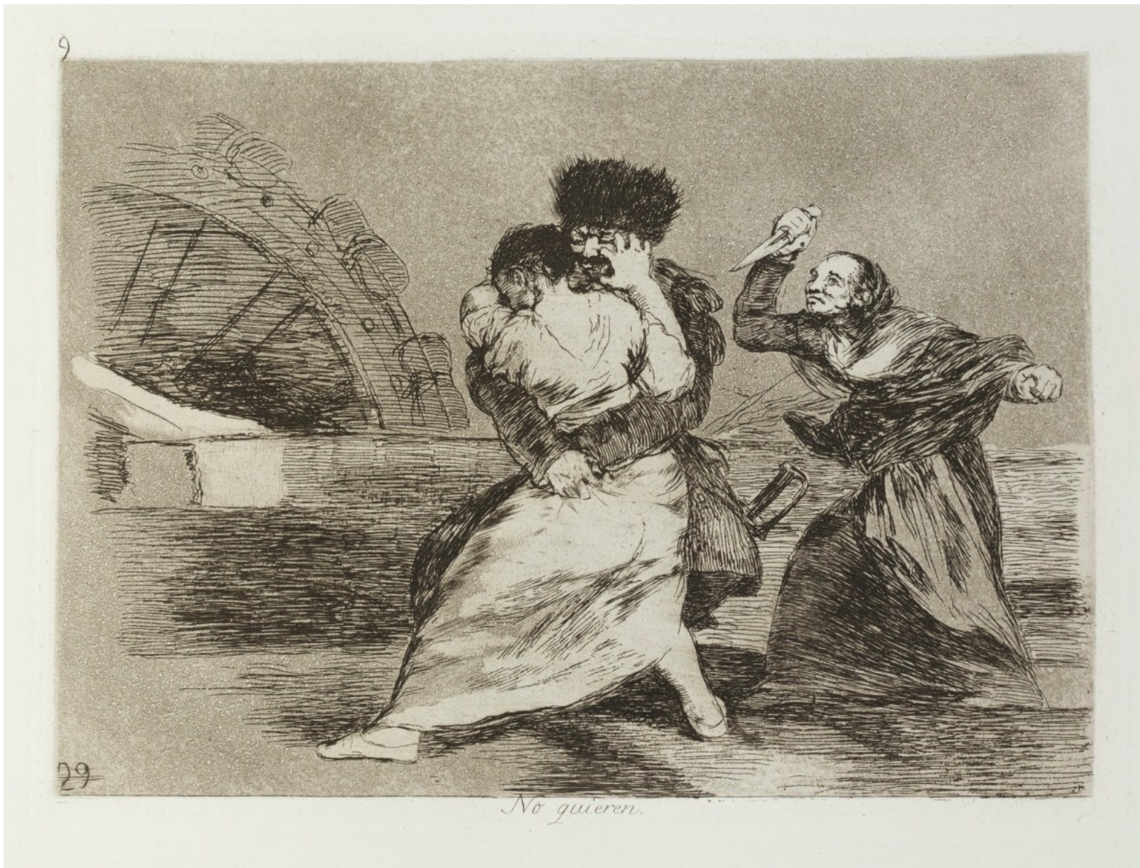
I Disastri della Guerra – F. Goya, 1863