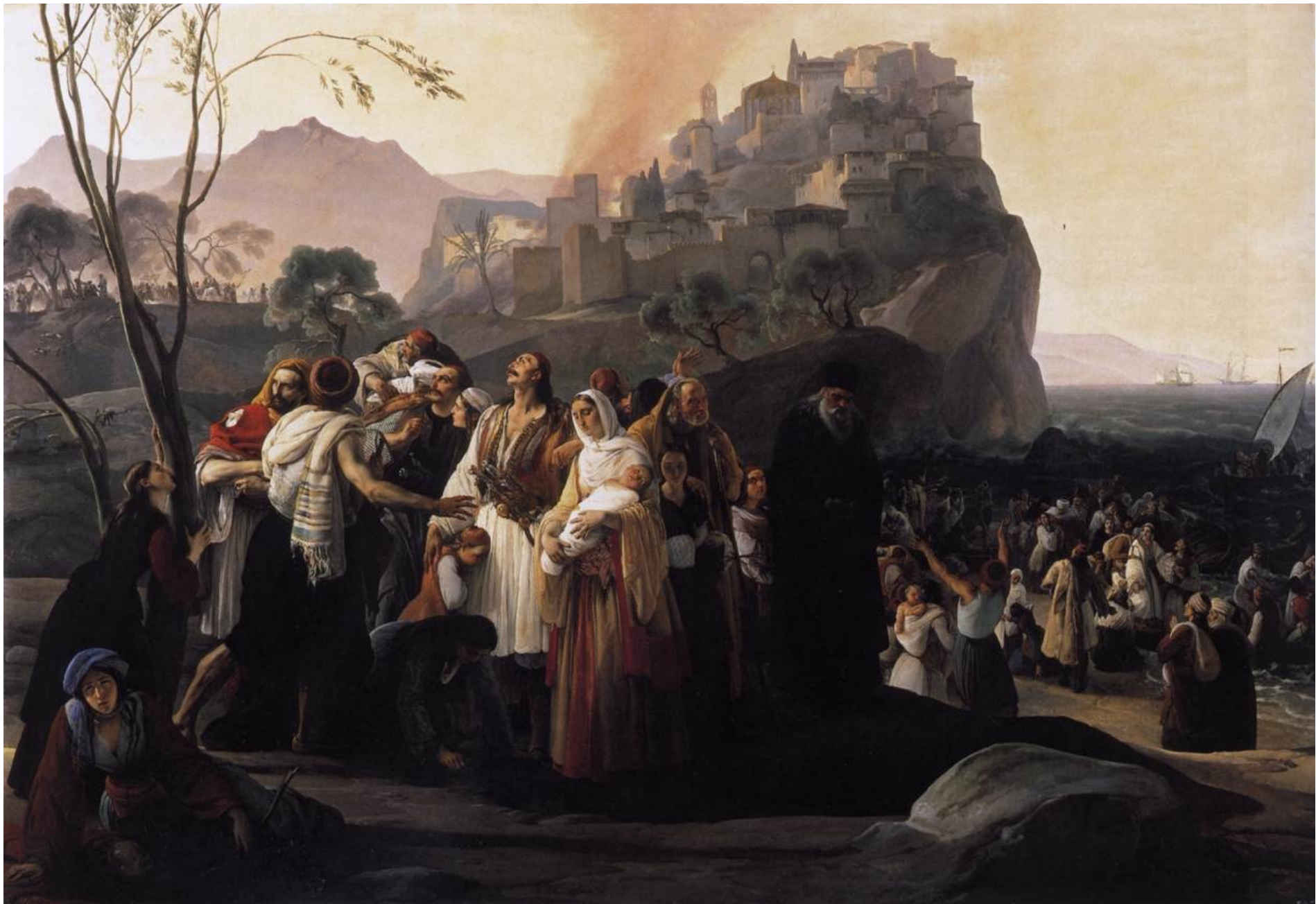
Francesco Hayez, I profughi di Parga , 1831, Brescia, Pinacoteca Tosio-Martinengo