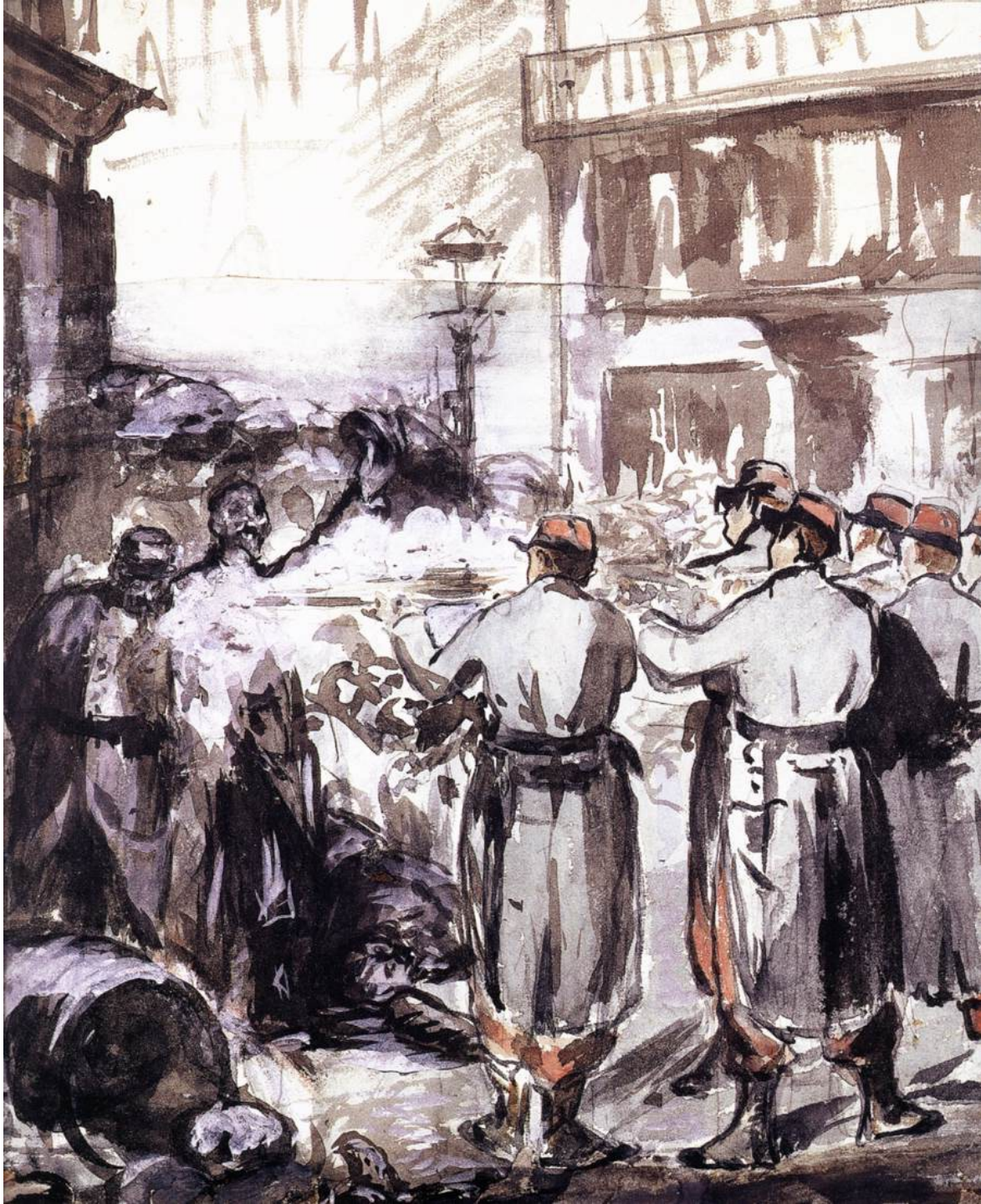
Edouard Manet, La barricata (Guerra civile) 1871 Budapest, Szépművészeti Múzeum