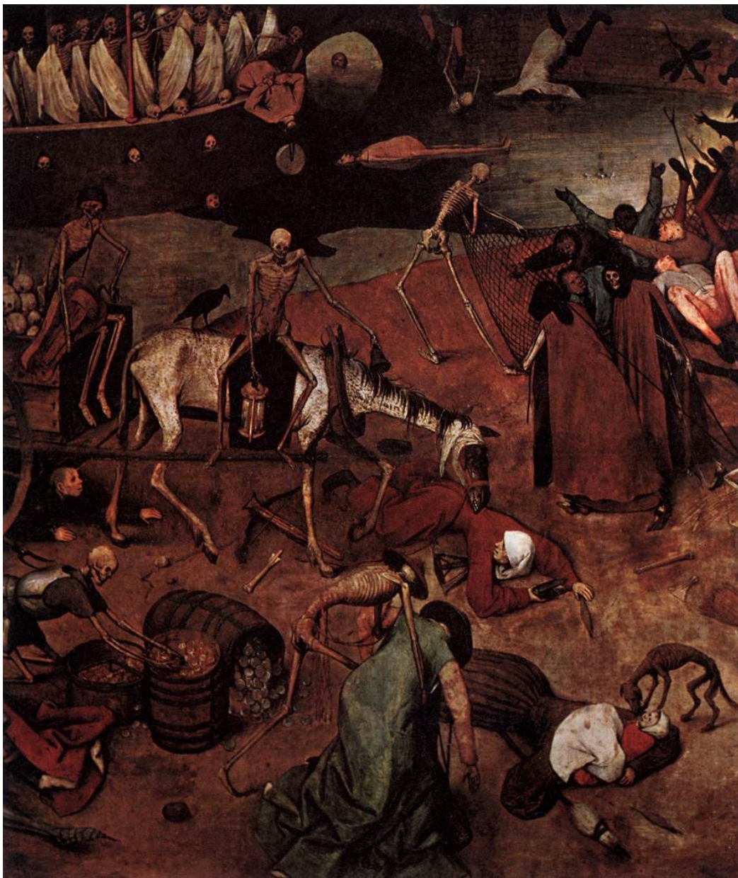
Pieter Bruegel il Vecchio, Trionfo della morte , particolare 1562 circa, Madrid, Prado