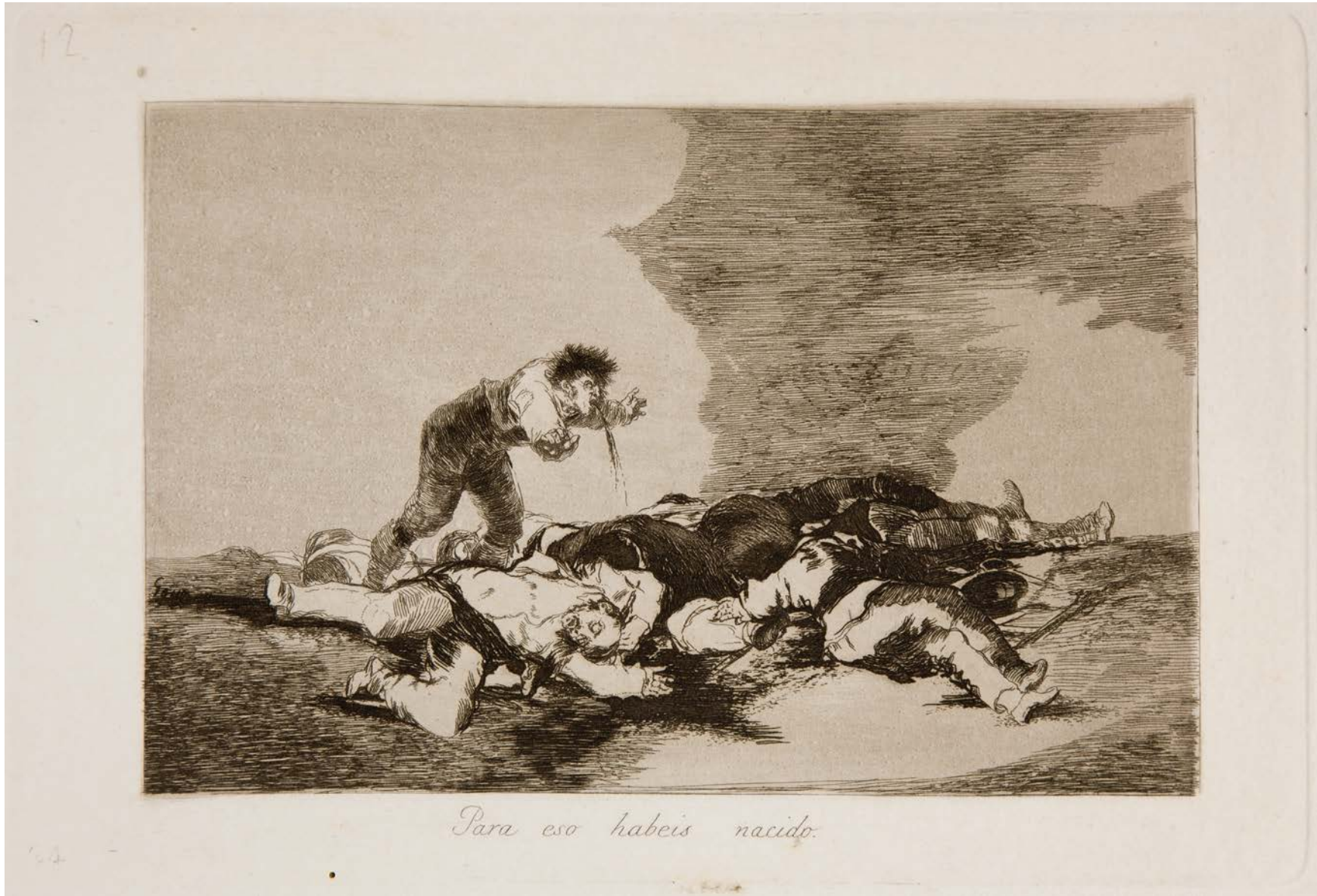
I Disastri della Guerra – F. Goya, 1863